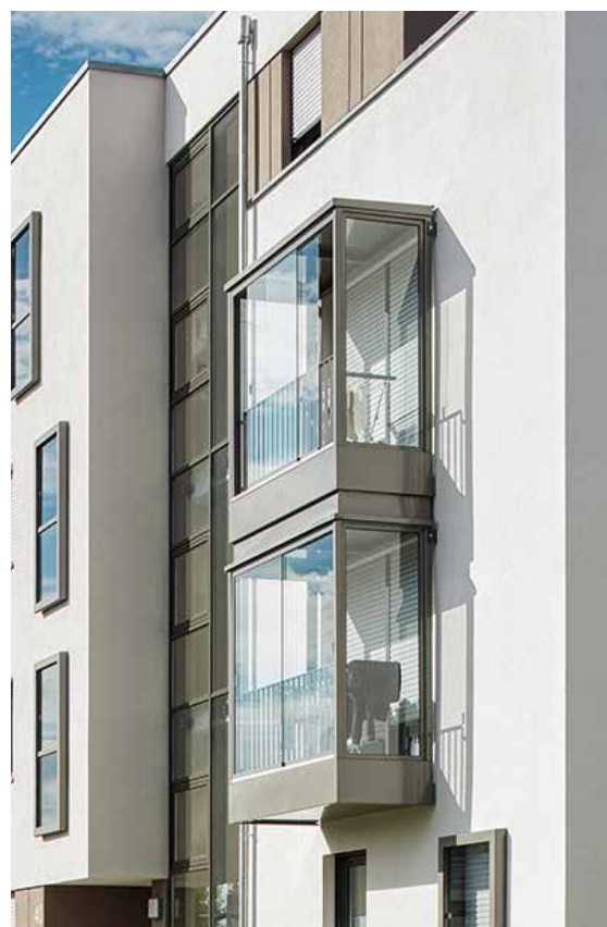
Bauherr: Wüstenrot Haus- und Städtebau GmbH

Hagenlocher GmbH Blumenstr. 31 · 74357 Bönnigheim Tel.: 0 71 43 / 88 59-0 · Fax: 0 71 43 / 88 59 29 www.hagenlocher-fenster.de · info@hagenlocher-fenster.de